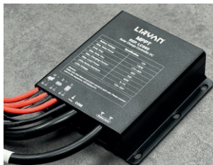
*Módulo opcional (no incluido)

Tecnología 4G de última generación en nuestros controladores de carga DC, esto facilita el pronóstico de mantenimientos correctivos y preventivos, facilita el control en tiempo real la generación de energía del módulo solar, el almacenamiento de energía y estado de carga de la batería, control de ubicación por medio de GPRS, logrando así la localización rápida de la luminaria.